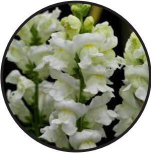
Lejongap, vit. 70 cm