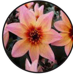
Dahlia, orange. 60-70 cm