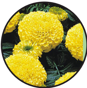
Stor tagetes. gul. 35 cm