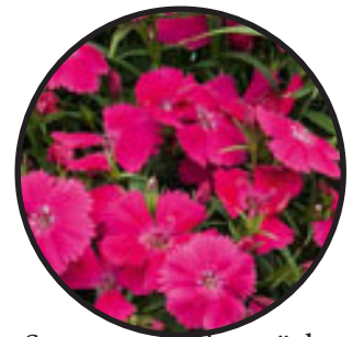
Sommarnejlika mörk- rosa. 30-35 cm