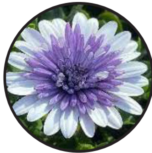
Stjärnöga, stålblå. 30- 40 cm