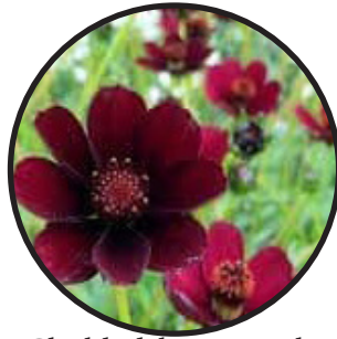
Chokladskära, mörk- röd. 30-70 cm