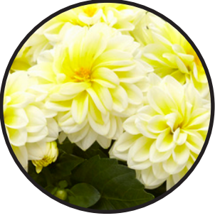
Dahlia, ljusgul. 40-60 cm