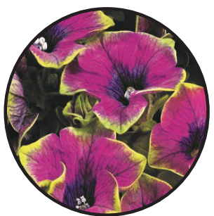
Hängpetunia, ceris- grön.