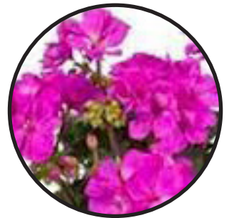
Pelargon, rosablå. 35- 40 cm