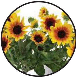
Låg solros, gul. 30-50 cm