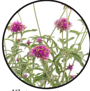
Klotamarant, rosa. 40-60 cm