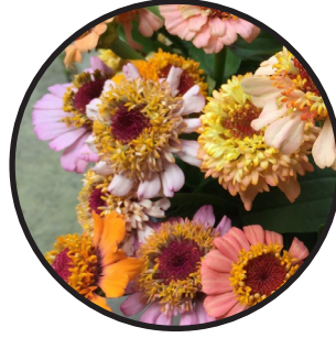
Zinnia, peache 60-80 cm