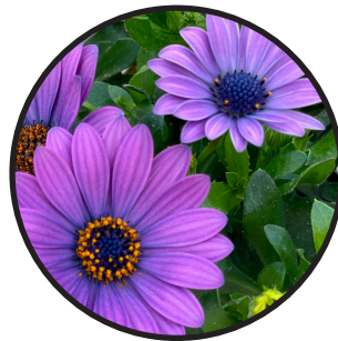
Stjärnöga, lila. 35 cm